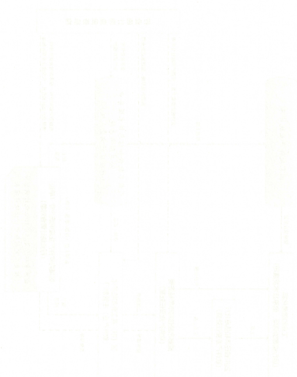
图例 成都高新技术产业开发区管委会各委办局